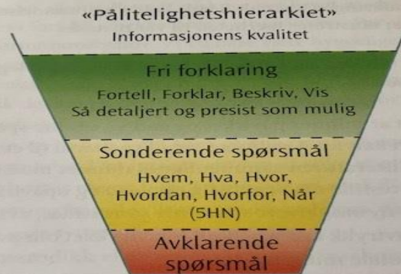
Figur 7. Pålitelighetshierarkiet (inspirert av Milne, 2006).